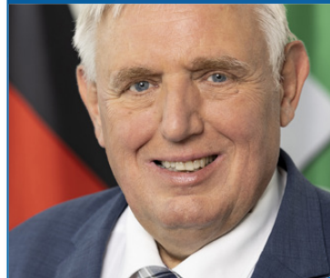
Karl-Josef Laumann, MdL Minister für Arbeit, Gesundheit und Soziales des Landes Nordrhein-Westfalen